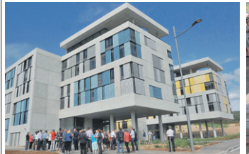
Svečanost otvorenja novolizgrađenih paviljona u Sveučilišnom kampusu na Trsatu